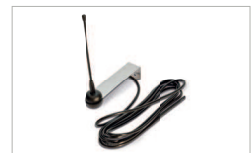
Antenna esterna / Outdoor antenna