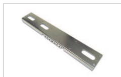
Staffa di supporto 1250 mm Support bracket 1250 mm