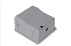
Kit batteria / Battery kit