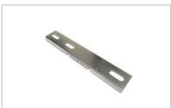
Staffa di supporto 615 mm Support bracket 615 mm