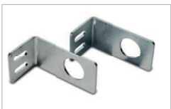
Staffa rinvio albero zincati Galvanised return arm support bracket