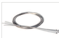
Cordino di sblocco External cable release kit