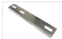
Staffa di supporto 2000 mm Support bracket 2000 mm