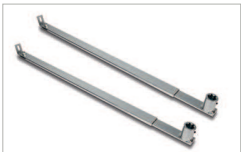
Bracci dritti con boccola scanalata zincati Galvanised straight arms with ribbed bushings