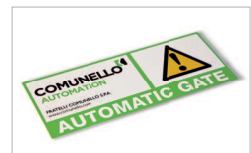
Tabella segnaletica / Signage table