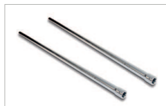
Rinvii L2000 / L1500 / L200 zincati Galvanised L2000/L1500/L200 return arms

AC 375 / L2000 AC 360 / L1500 AC 370 / L200