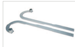
Bracci curvi con boccola scanalata zincati Galvanised curved arms with ribbed bushings