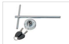
Sblocco da esterno basculante zincato Galvanised external release lever

AC 375 / L2000 AC 360 / L1500 AC 370 / L200